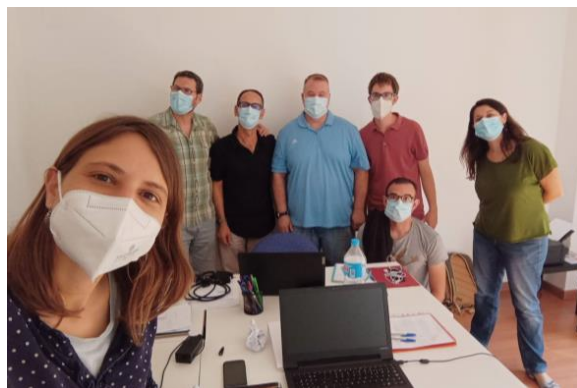
El equipo de Nautae

Por todo esto, valoramos que 2021 ha sido un año intenso, de grandes retos y aprendizajes, pero también de grandes logros. Sabemos que nos queda mucho por hacer, pero tenemos energía e ilusión para muchos años de travesía.